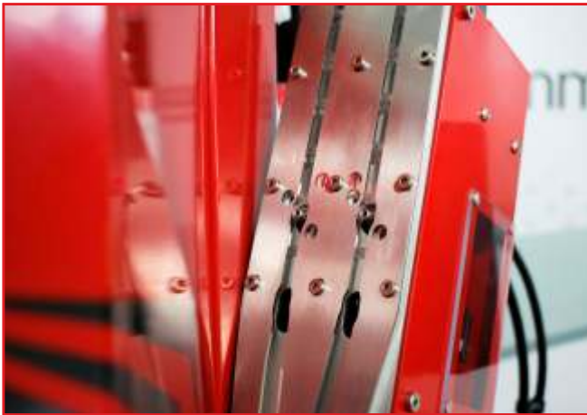
Doble rampa de arandelas