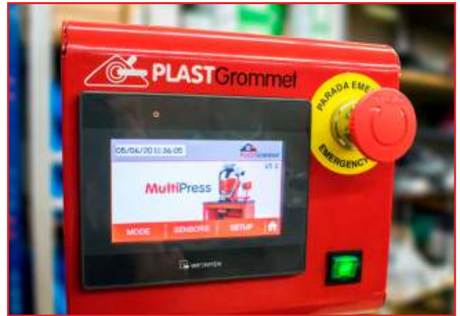
Pantalla táctil a color